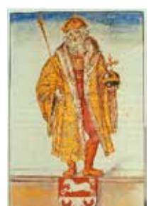
Otto den Store