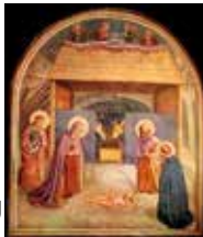
Fra Angelico: Jesu fødsel