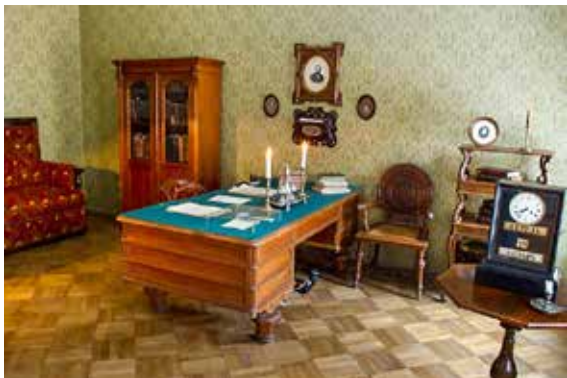
Fjodor Dostojevskijs arbejdsværelse

"Raskolnikov" er en sådan ung nihilist, som overbeviser sig selv om, at han har lov til at myrde en led gammel pantelånerske for at skaffe midler til sit eget, sin mors og sin søsters underhold. Det er ingen forudsætning for at deltage i studiekredsen, at man har læst bogen på forhånd.