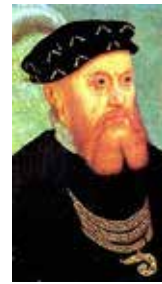
Chr. den 3.