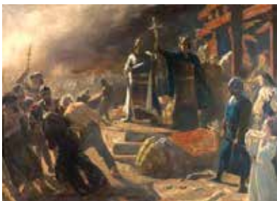
Absalon i Arkona