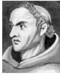
William af Ockam