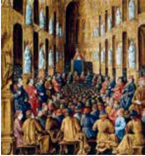
Urban den 2.s tale

Korstogene og stridighederne mellem pave og kejser. Pavekirken i forfald.