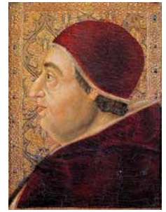
Alexander den 6.