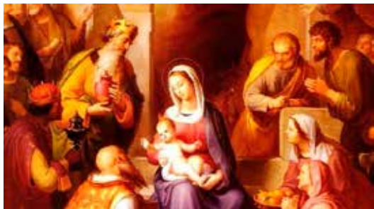
Franz von Rohden (1817-1903)

Vi holder en fælles juleafslutning for skole og børnehave. 3. klasse opfører krybbespil. Forældre og bedsteforældre er også hjerteligt velkomne.