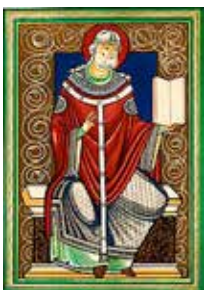
Gregor den første

Pavekirke, Islam, kristenhedens forsvarere: det frankiske og det tysk-romerske kejserdømme.