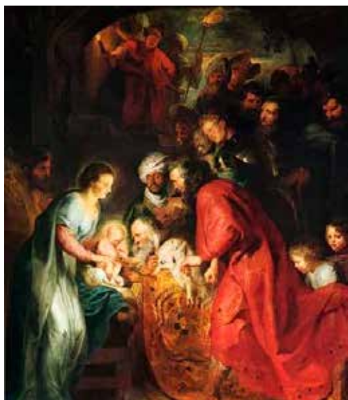
Sint Janskerk, Mechelen

Vi inviterer alle børn, som er døbt i kirkerne og som fylder seks år i 2015, sammen