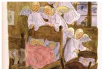
Herluf Jensenius: Illustration til "Velkommen igen, Guds engle små..."

Onsdag den 24. kl. 14.30 og 16.00 Juleaften