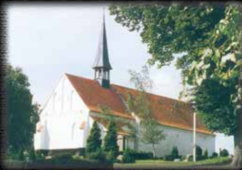
December 2014 - februar 2015