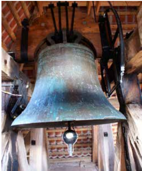
Den nye klokke fra 1921 i Sankt Johannes Kirke, Kegnæs