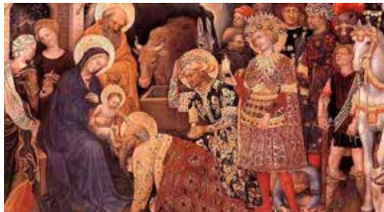
Gentile de Fabriano 1423

Lysabild Skoles juleafslutning med krybbespil i Lysabild Kirke.