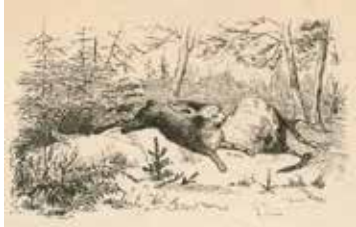
Illustration til H. C. Andersens "Grantræet"