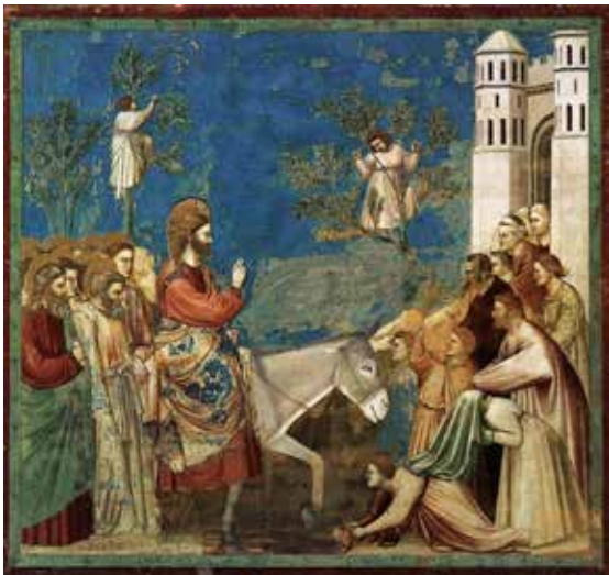
Giotto: Indtoget i Jerusalem

Endnu engang begynder vi forfra i alterbogen og begynder et nyt kirkeår med at vente på ham, der kommer.