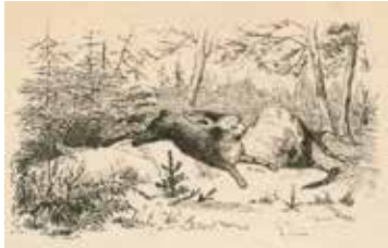
Illustration til H. C. Andersens "Grantræet"