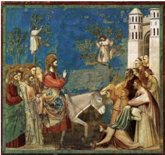
Giotto: Indtoget i Jerusalem

Endnu engang begynder vi forfra i alterbogen og begynder et nyt kirkeår med at vente på ham, der kommer.