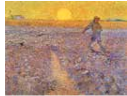
Sædemand - af van Gogh