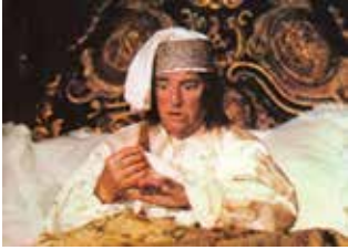
Buster Larsen som Jeppe på Bjerget

Holberg ( 1684 – 1754) er blevet kaldt "den danske litteraturs fader".