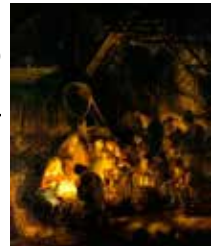
Rembrandt: Jesu fødsel

Som de foregående år: Sydalskoret og Hørup Kirkes Ungdomskor synger, minikonfirmanderne opfører krybbespil og pigerne fra kirkekoret går Lucia.