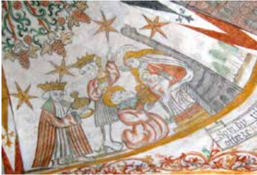
De hellige tre konger – kalkmaleri fra Sulsted kirke