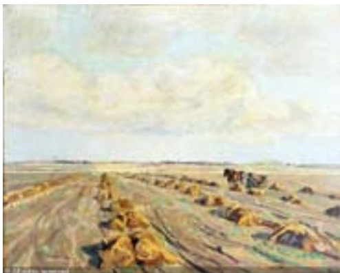
Oktoberbillede af Fritz Syberg